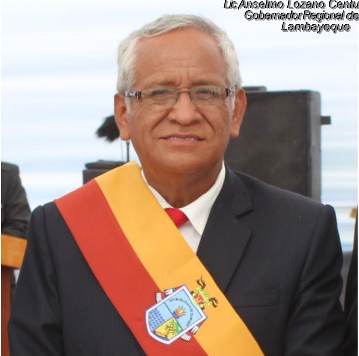
Lic. Anselmo Lozano Centurión Gobernador Regional de Lambayeque